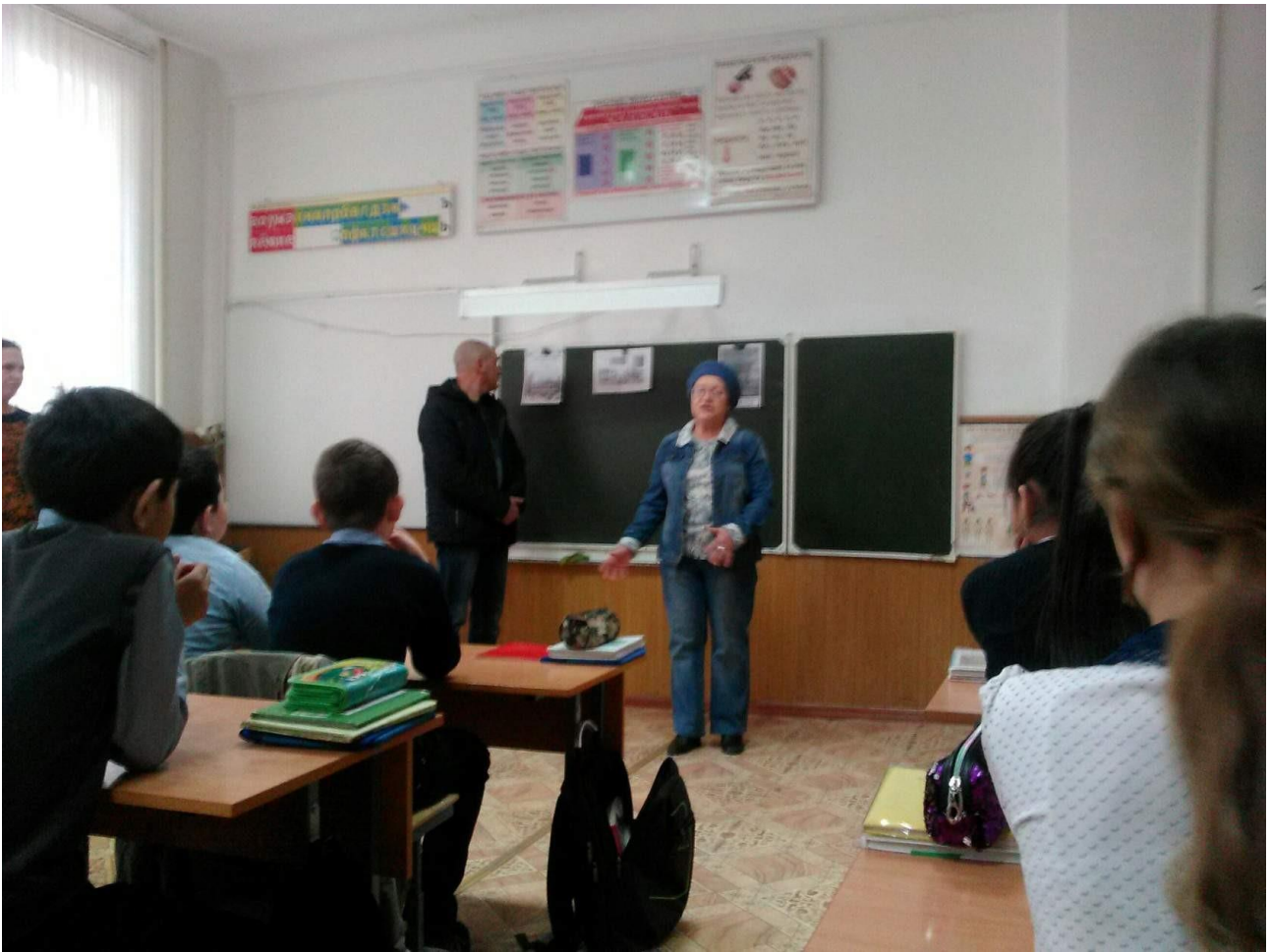
Лекция работников лесхоза. В рамках реализации проекта «Одноразовые маски - спасение или угроза» ученики в группе Vk организовали соцопрос группы «Разделяй с нами».